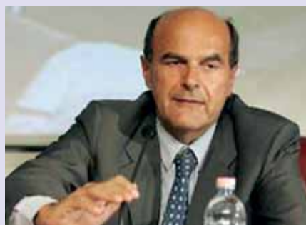
Il ministro Pier Luigi Bersani

Tempi più rapidi e meno spese per cancellare le ipoteche sugli immobili. Dopo avere estinto i mutui ipotecari sugli immobili, i titolari non dovranno più affrontare nuove spese per cancellare l'ipoteca. Sarà compito dell'istituto, comunicare alla Conservatoria l'avvenuta estinzione del mutuo, quest'ultima provvederà direttamente d'ufficio alla cancellazione della relativa ipoteca. Gli operatori avranno 60 giorni per adeguarsi alle nuove norme.