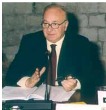
Gian Carlo Sangalli, Segretario generale della CNA

"Dobbiamo affrontare e risolvere questioni importanti e nuove: la globalizzazione, nuovi equilibri delle economie e dei commerci mondiali, le questioni del mondo dopo l'11 settembre. Siamo consapevoli che il Paese ha bisogno di cambiare rotta: abbiamo alle spalle anni difficili, l'economia è cresciuta poco, i conti dello Stato sono peggiorati, la concorrenza internazionale è sempre più dura. E siamo consapevoli che veniamo da una lunga stagione, iniziata subito dopo l'entrata nell'euro, in cui è mancato il coraggio di chiedere a tutti di fare la propria parte e di fare tutti i sacrifici necessari. C'è stato un deficit di coraggio della politica tutta e più in generale di tutta la società italiana. Non vi sarebbe nulla di più