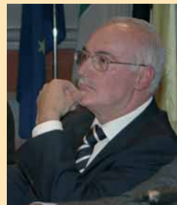
Un momento di riflessione per il presidente e il presidente Piero Marrazzo.