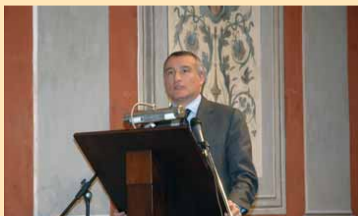
Il presidente inizia il suo intervento: "Auguri, CNA".