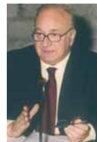
Gian Carlo Sangalli

"Come uomo d'impresa, mi aspetto che la politica faccia ripartire il Paese. Dobbiamo fare - sottolinea Sangalli - una cura motivazionale all'Italia perché lo Stato sia un luogo dove l'obiettivo di tutti sia lo sviluppo. Insomma, in questo Paese dobbiamo recuperare il cuore".