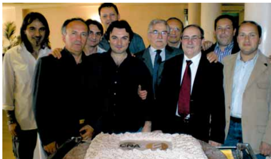
Nella foto, il direttivo dell'Associazione Provinciale Panificatori e Pasticceri

Quello della panificazione è, nella Tuscia, con le sue 170 imprese, un settore fortemente legato alla tradizione e al territorio, rispettoso dell'ambiente e della salute del consumatore, attento alle innovazioni.