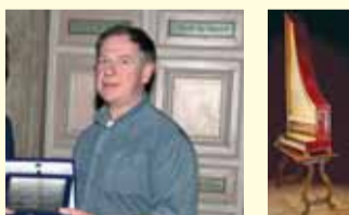
Clavicembalo in stile italiano