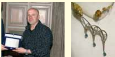
Omaggio a Viterbo