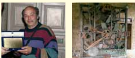
Macchina del tempo