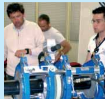
Un momento del corso

Si è concluso il corso per la qualifica di saldatore di tubi e raccordi in politilene, organizzato da CNA Sostenibile, in collaborazione con Enaip Lazio e ASQ Servizi e Tecnologie di Saldatura. Gli operatori impiegati nella giunzione, per saldatura, di tubi e condotte in polietilene, devono possedere un attestato di qualifica rilasciato da un ente di certificazione. Per ottenere questo "patentino", i titolari e gli addetti del settore dell'impiantistica termoidraulica sono tenuti a frequentare un corso di formazione e sostenere un esame.