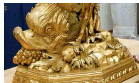
Artigianato artistico e tradizionale, particolare