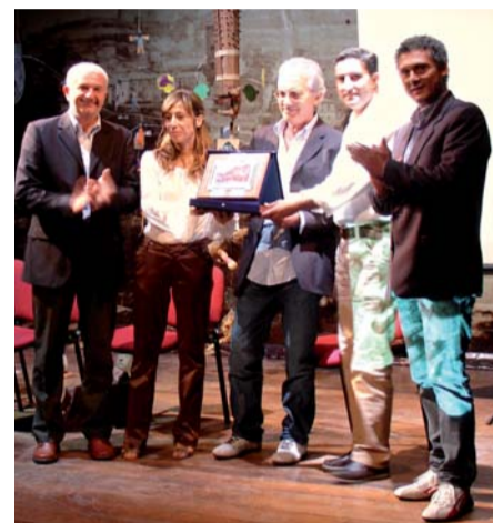
Premiazione dei Sugaroni

Come, appunto, i lavori della tradizione contadina e artigiana.